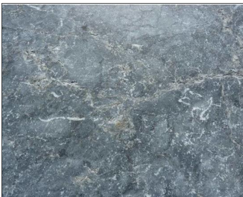
Vorhd. Blaustein-Platten 90x60cm

Man könnte den Blauton der vorhandenen Platten mit taupe und creme verbinden und so eine elegant-natürliche Farbstimmung schaffen.