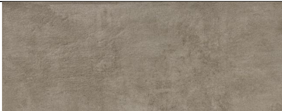
Pflasterergänzung 2 (Seitenflächen): Creative line 44084, 40x20cm (W&H)