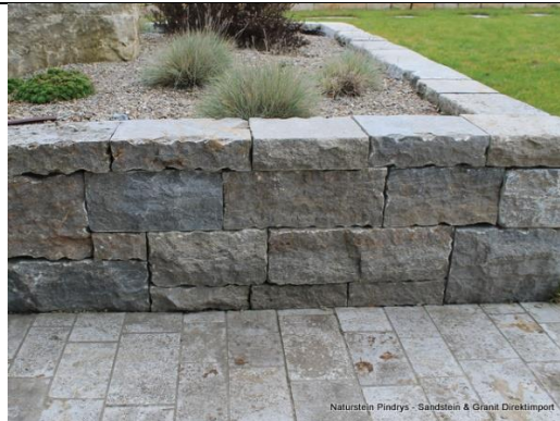
Mauer: Muschelkalk gesägt (Pindrys)