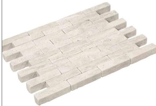
Pflasterergänzung 1 (Linien): Travertin creme 20x5cm (Oprey & Beisterveld)